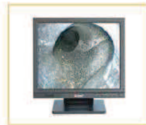
TFT Color Monitor