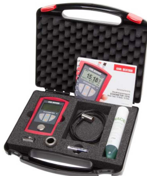
Dostarczany w poręcznej walizce

Wszystko to sprawi że mamy do czynienia z dokładnym i niezawodnym urządzeniem, nawet w trudnych warunkach pracy.