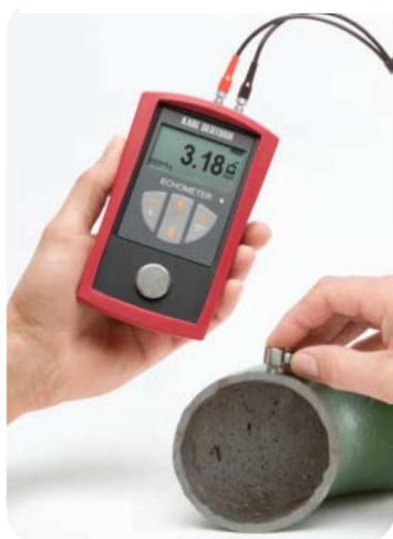
Pomiar grubości ścianki na rurze za pomocą mikrogłowicy

Podstawowa wersja miernika ECHOMETER 1076 umożliwia szybki i łatwy pomiar grubości ścianki w zakresie 0,5 do 400mm i prędkości dźwięku pomiędzy 100, a 19.999m/s.