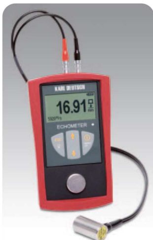
Duży, czytelny, podświetlany wyświetlacz